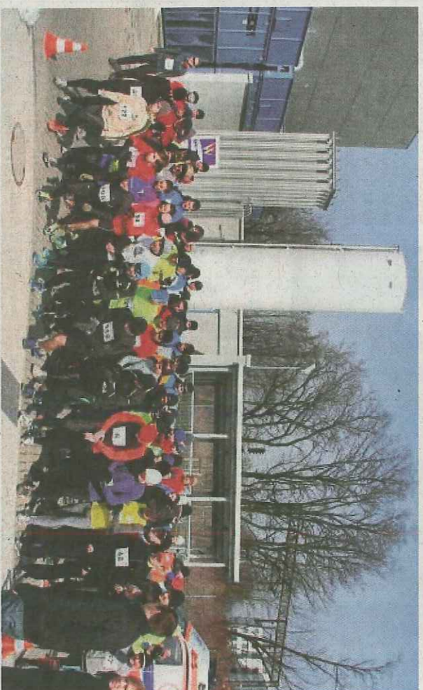
Wroclawski Park Technologiczny krzewi aktywność fizyczną i promuje zdrowy styl życia

Wroclawski Park Technologiczny mówi jednak stanowczo „nie” jesiennej melancholii. Zamiat siedzenia w domu zachęca do aktywności fizycznej, a zamiast leków na przeziębienia i grypy – suplementy diety i wzmacnianie odporności organizmu. Takie podjęcie spr-aw, że jesień jawić się będzie tylko w kolorowych barwach.